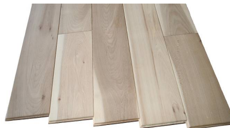
FNK-150 サイズ: 15mm x 150mm x 乱尺 にれ(北海道産) 定価: ¥14,000/㎡ FNK-120 サイズ: 15mm x 120mm x 乱尺 にれ(北海道産) 定価: ¥13,000/㎡

科:ウコギ科 産地:北海道 特徴:全体に淡い灰黄色～淡い灰褐色で、辺心材の境目は不明瞭。木理は交錯し、肌目も粗いが、板目面は光沢があり年輪模様が美しい。やや軽軟で加工性がよく、仕上げ面に美しい空目が現れる。耐朽性は小～中程度。