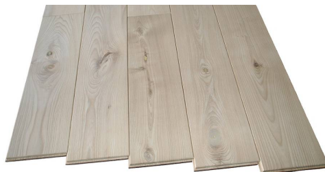
FSK-120 サイズ: 15mm x 120mm x 乱尺 せん(北海道産) 定価: ¥13,000/㎡

北海道の大地で育まれた天然木のフローリング“せん”と“にれ”のフローリングです。本物ならではの存在感が特徴的です。色むらや大きな節・小さな節が、個性的で風合いのある空間を演出してくれます。